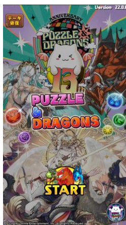
ゲームタイトル画面