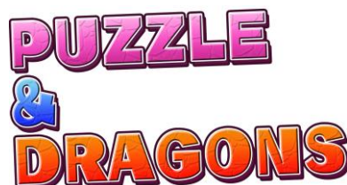
『パズル&ドラゴンズ』ロゴ